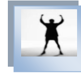
( -ว่าง- ) นักวิชาการศึกษา(ปก./ขก.) โทร.๐๘๙-๗๑๓๙๕๙๑