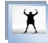
( -ว่าง- ) ครูผู้ดูแลเด็ก โทร. -