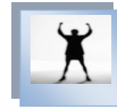
( -ว่าง- ) นักวิชาการศึกษา(ปก./ขก.) โทร.๐๘๙-๗๑๓๙๕๙๑