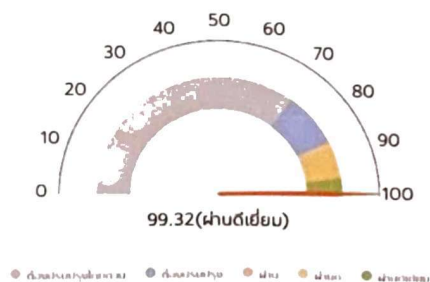
ผลการประเมินในภาพรวม

องค์การบริหารส่วนตำบลหัวหนอง ได้รับผลการประเมินคุณธรรมและความโปร่งใสในการดำเนินงานของหน่วยงานภาครัฐ (ITA) ประจำปีงบประมาณ พ.ศ.2566 โดยมีค่าคะแนนโดยรวม เท่ากับ 99.32 อยู่ในระดับ “ผ่านดีเยี่ยม” (99.32 คะแนน)